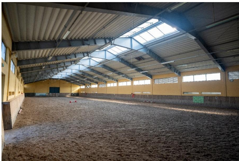
Hala treningowa (rozprężalnia) 60 m x 20 m